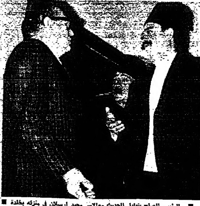
الرئيس الصلح يتبادل الحديث مع الوزير رشيد الصلح في منزله بخلفة

كان لقاء صباح ومصالحة بين الرئيس رشيد الصلح والوزير رشيد الصلح ، في خلد امس ، بعد قطيعة استمرت شهرين . وقال وزير الصحة بعد الاجتماع : طالما هيك بدو اسر طوني .. قد انتهى المطوع والحكومة ستلحق الثقة ، ولازم يعرف انو نسي مير مجيد واحد بهالولد .